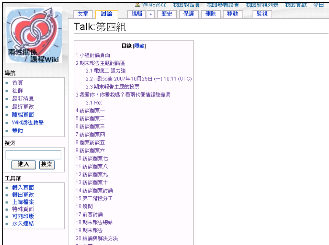
圖 8 小組頁面