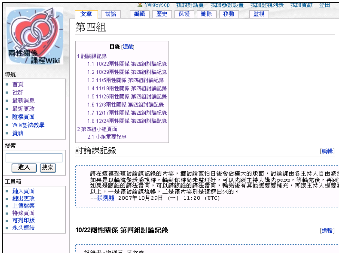
圖 9 小組作業討論頁面