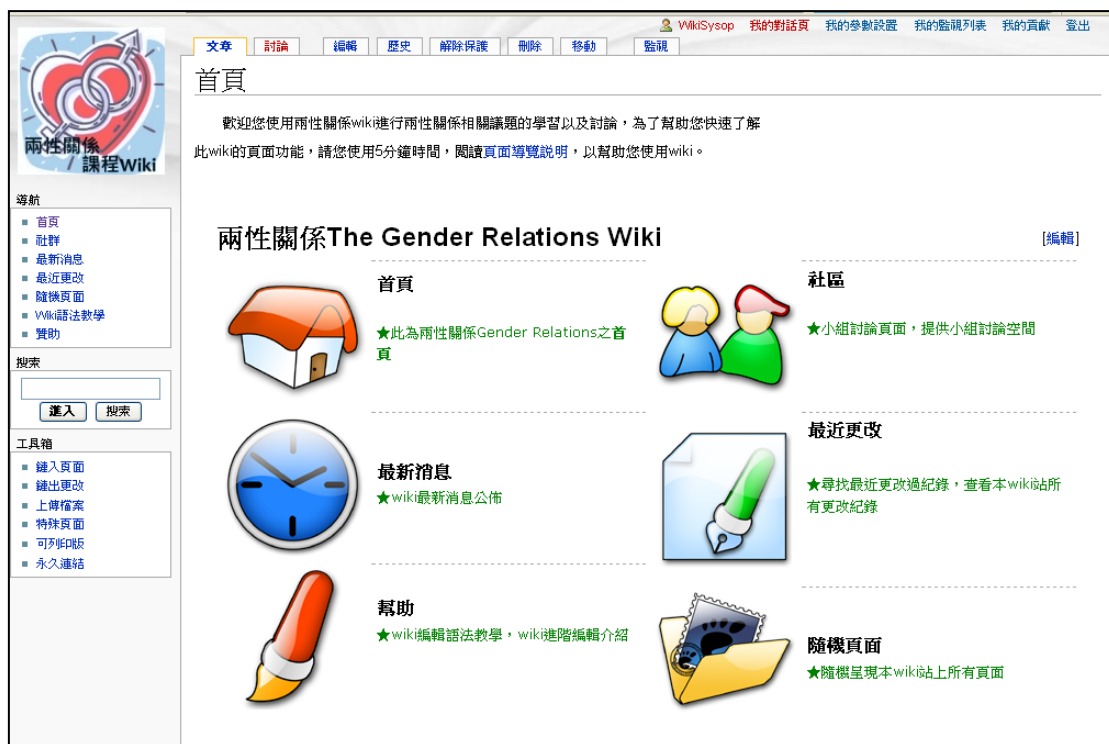
圖 3 兩性關係 wiki 平台首頁