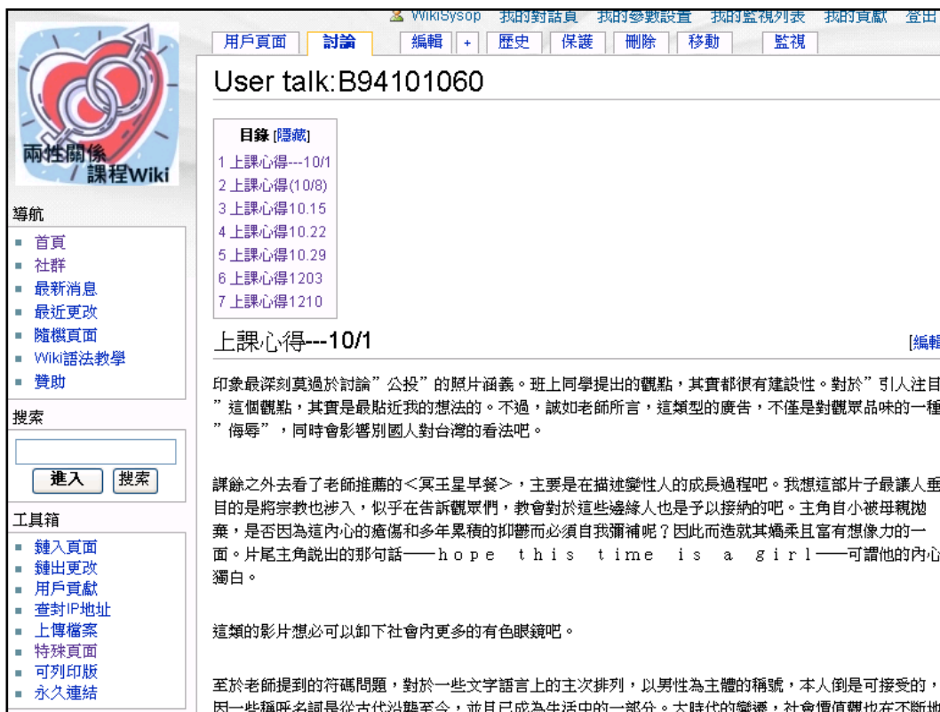
圖 4 學生個人心得頁面