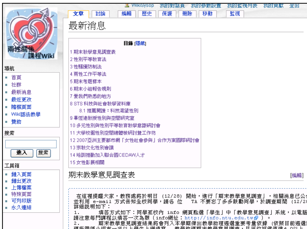
圖 5 最新消息頁面